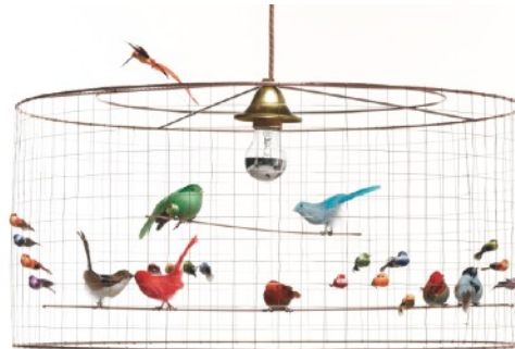
Demi Grande (S2ET6)