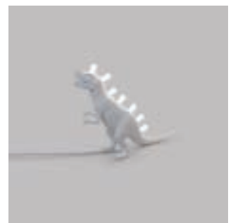
ART. 14763 - TREX

Zタイプの接続について、本照明器具の外付けフレキシブルケーブルやコードを交換することはできません。コードが破損した場合は、照明機器を解体処分する必要があります。