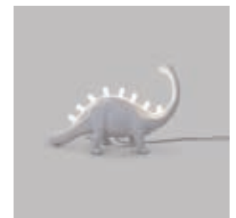
ART. 14762 - BRONTOSAURUS