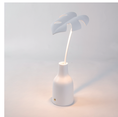
LEAF LIGHT DELICIO_09023

不得将本设备当作普通生活垃圾进行处理。本设备的标志符合电气和电子设备 (WEEE) 的欧洲指令 2012/19/EU。本指令定义了在整个欧盟范围内现行的废弃电器收集和回收的法规。如需退还废弃设备，请采用各使用国适用的返还和收集系统。