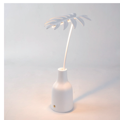
LEAF LIGHT STELLOU_09024